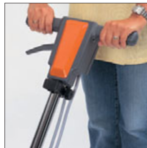
Ergonomisch: Stufenlose Deichsel- bzw. Stielverstellung gewährleistet eine perfekte Höhen-Einstellung.