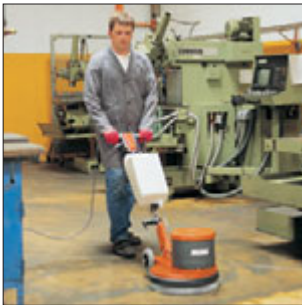
Hako-Super 43/180 Die Standardmaschine für die Grund- und Unterhaltsreinigung. Typischer Einsatz: Teppichschampooierung und die Grundreinigung aller Hartbodenbeläge.