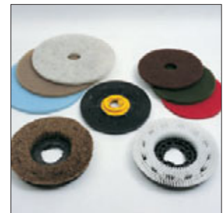
Umfangreich: Die große Auswahl an Bürsten, Pads und Treibteller deckt alle Einsatzmöglichkeiten ab.