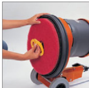
Serienmäßig: Padhalter mit Centerlock zum schnellen werkzeuglosen Wechsel des Polierpads.