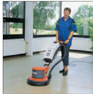
Hako-Super 43/450 High-Speed-Maschine zum Hochglanzpolieren und Cleanern. Bauweise wie Hako-Super 43/180. Typischer Einsatz: Polieren von weichen Beschichtungen.