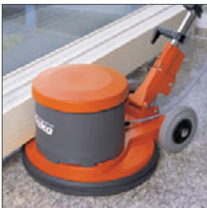
Der flache, auskragende Bürstenkopf ermöglicht das Arbeiten auch unter Heizkörpern etc.