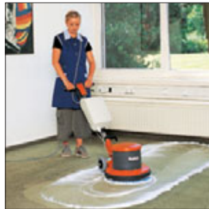
Hako-Super 43/2-speed Universelle Einscheibenmaschine für den Schrubb- und Poliereinsatz durch 2 einstellbare Drehzahlen. Typischer Einsatz: Schrubben und Polieren mit einer Maschine.