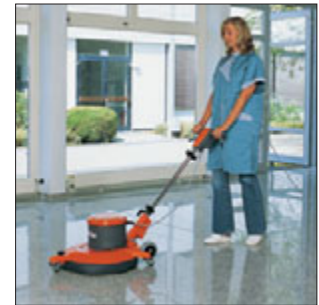
Hako-Super 53/1100 High-Speed-Maschine zum Polieren, Cleanern und Spraysen. Höhere Produktivität durch Powerflow. Typischer Einsatz: Polieren von modernen Hartbodenbelägen.